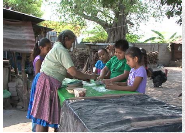
Encuadre Alejado ¿Dónde están?