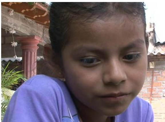
Encuadre Cercano ¿Quién está ahí?