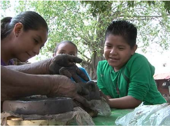
Encuadre Básico ¿Cómo se hace el barro?