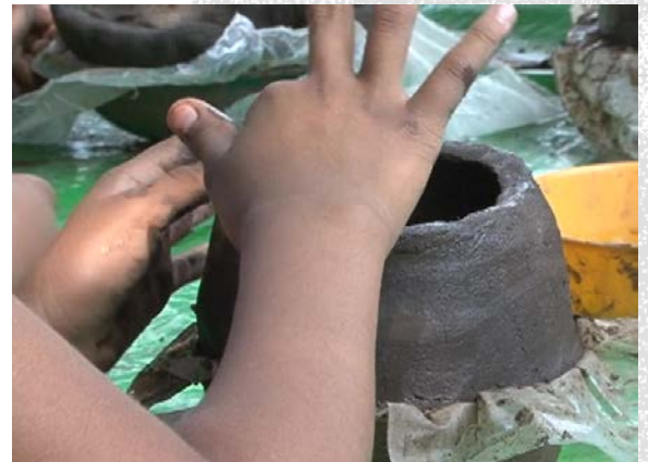
Encuadre Detalle ¿Puedo descubrir algo más?